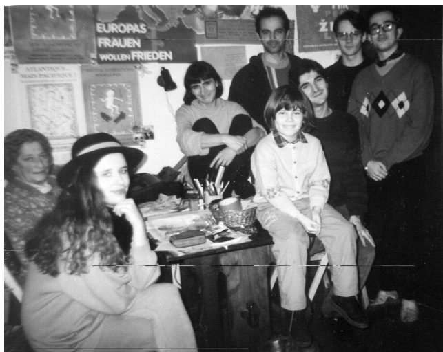
Prostorije Žena u crnom u Cetinjskoj ulici, januar 1994.