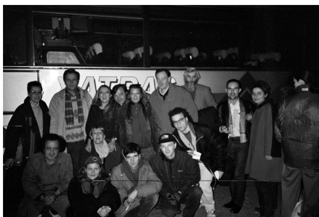
Leteća učionica radionica, 1992.

Delovi objavljeni: – u biltenu Arkadija br.1., Beograd 1994. Žene za mir 1994. , Žene u crnom, Beograd Čitav tekst je štampan u Lavirintski rečnik – Pariz – Njujork; Rende, Beograd 2001.