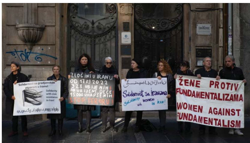
Beograd, 11. novembar