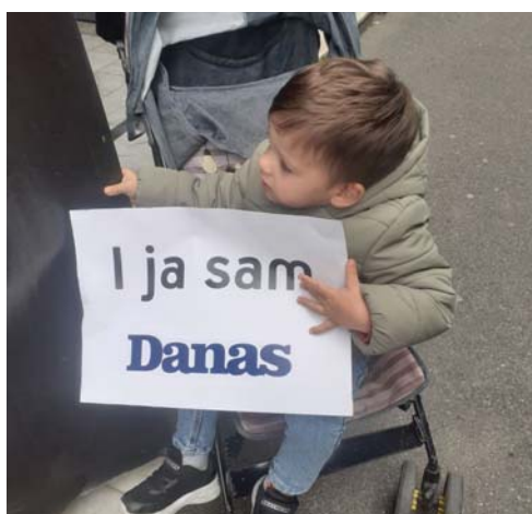
Beograd, 14. novembar

Beograd, 11. novembar „Sve smo mi Danas!“ – Akcija solidarnosti sa novinarima/kama dnevnog lista Danas zbog pretnji smrću (upućenih redakciji 6. novembra 2022.) zbog 'njihove uređivačke politke'; u mejlu piše da će novinari/ke završiti kao Šarl Ebdo' tj. da će biti ubijeni. Akcija je čin solidarnosti sa hrabrim i odgovornim novinarima/kama Danas -a, odbrana ljudskog dostojanstva novinara/ki Danas -a, ali i svih nas jer je to napad na sve nas koji smo slobodnomisleći i koji razmišljamo drugačije od režima. U ovoj ad hoc akciji učestvovalo je desetak aktivistkinja i aktivista ŽUC-a, uz podršku Autonomnog ženskog centra/AŽC. Valja napomenuti da je Tužilaštvo za visoko tehnološki kriminal odmah započeo postupak, reagovala su novinarska udruženja, političke stranke, međunarodne organizacije zahtevajući da se pod hinto pronadu počinioci. Međutim, do kraja decembra 2022. istraga nije dovela do identiteta osobe koja je poslala pretnje.