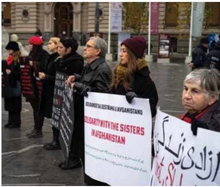
Beograd, 6. decembar